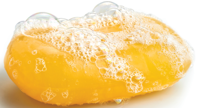
Lávese las manos.